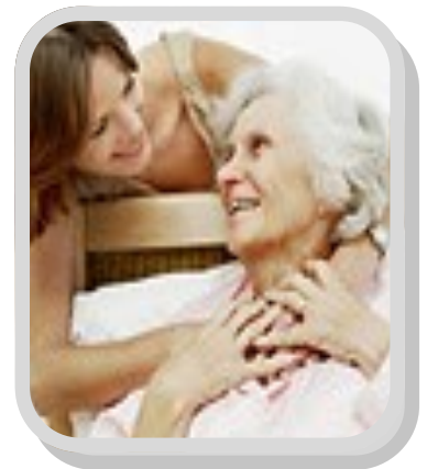
Maak self die keuse met 'n lewende testament

As daar geen redelike vooruitsig is op my herstel van liggaamlike siekte nie, of as verswakking verwag word, wat my ernstige elendes sal besorg, of my onbevoeg sal maak vir 'n rasionele bestaan, versoek ek om toegelaat te word om te sterf en nie kunsmatig aan die lewe gehou te word nie en dat ek die nodige medikasie sal ontvang om my vry van pyn en angs te hou. Dat alle lewensbehoudende stelsels met omsigtigheid gebruik sal word om die lewe te behou. Hiermee gee ek die geneesheer wat my op daardie tydstip behandel, toestemming om alle toestelle wat my aan die lewe hou, af te skakel. Bron: personeel@pcbrouwer.co.za