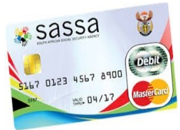
The SASSA card

Visit your nearest SASSA office with all your enquiries. Contact details: Hotline: 0800 601 011 Website: http://www.sassa.gov.za