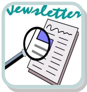
Navorsing en wedstryd oor aftree-oord nuusbriewe

Gryskrag, in samewerking met Plus50 , is van voorneme om navorsing te doen oor die Nuusbriewe wat as 'n tipe mondstuk gebruik word by aftree-oorde en soortgelyke leefstylkomplekse vir afgetredenes.