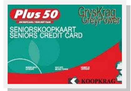
Seniorskoopkaart van Gryskrag

Martie Squier: 071 7372 549 of 012 3483087 of info@gryskrag.co.za