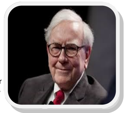
Warren Buffett from Berkshire Hathaway

knowledge and stability, their sticking around for longer than ever means that fewer seats can open up for candidates more familiar with the latest technology, social media and changes in consumer tastes. The experience that comes with age sometimes trumps knowledge of new trends. The number of older directors is likely to grow as many companies limit their top executives to one outside directorship. With fewer working executives available, boards are relying on retired ones more.