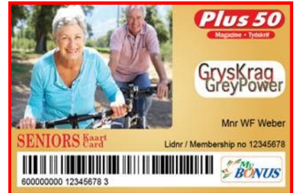
MyBonus/GreyPower Loyalty card

Your points are just one click....one phone call.... or one swipe away.