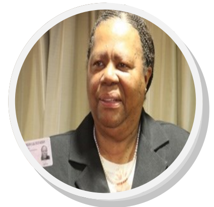
Home Affairs minister Naledi Pandor

In October 2015, SA won an award for the best designed smart ID card for 2014 during the Asia, Middle East and Africa High Security Printing Conference, held in Bangkok. Roll-out of the smart IDs will take six to eight years to complete.